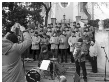
Bambiny má bratra aneb Truhláři z Marsu.

Pěvecký sbor složený ze štamgastů místní hospody podává téměř profesionální výkony a každoročně zpestří průběh tradičních vánočních trhů. Ty ve Starči letos probíhaly už po osmé. I když sami koledníci tvrdí, že nerapují, ale pouze deklamují a dokrášlují lidové písničky a lidové koledy, jejich vystoupení je nezapomenutelným zážitkem. „Kromě toho, co mají za