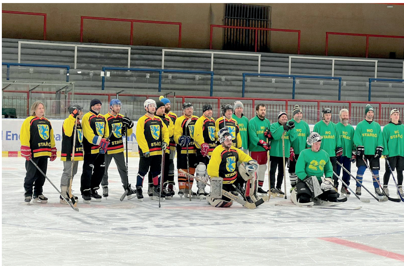
Amatérský hokejový zápas na ZS v Třebíči