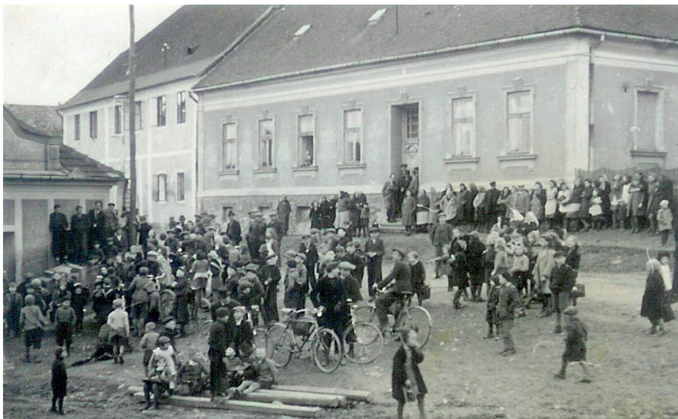
Snímání kostelních zvonů za II. světové války