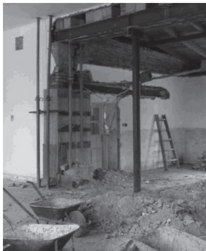
Stav po vybourání příčky

Do budoucna nás ještě čeká rekonstrukce sociálního zařízení, které je po desítkách let provozu již ve velmi špatném stavu.