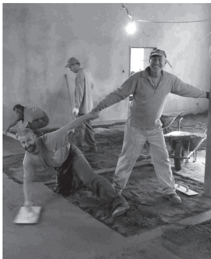
V průběhu prací