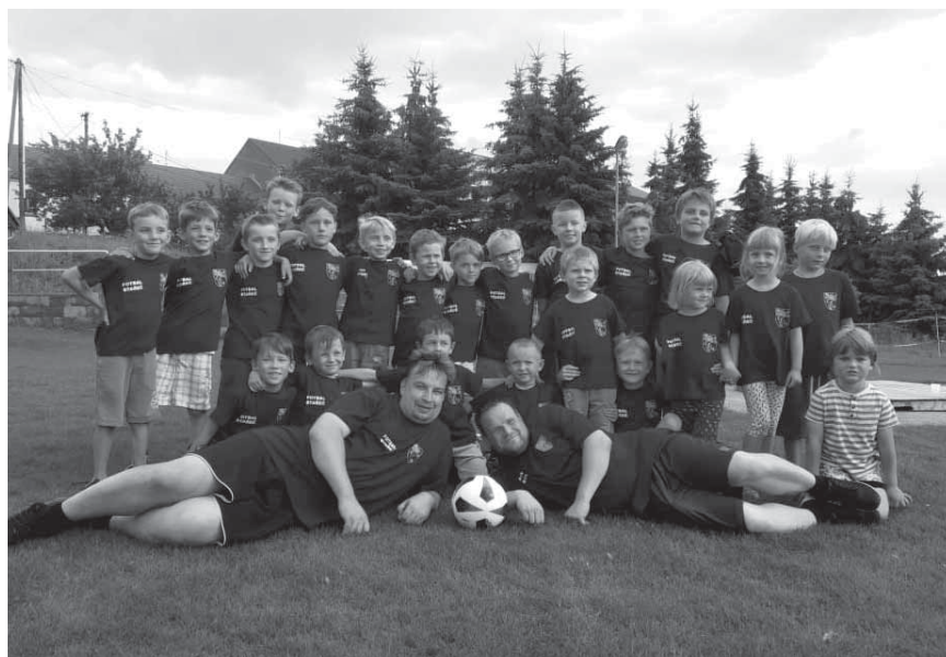
Mladší přípravka – foto ze zakončení