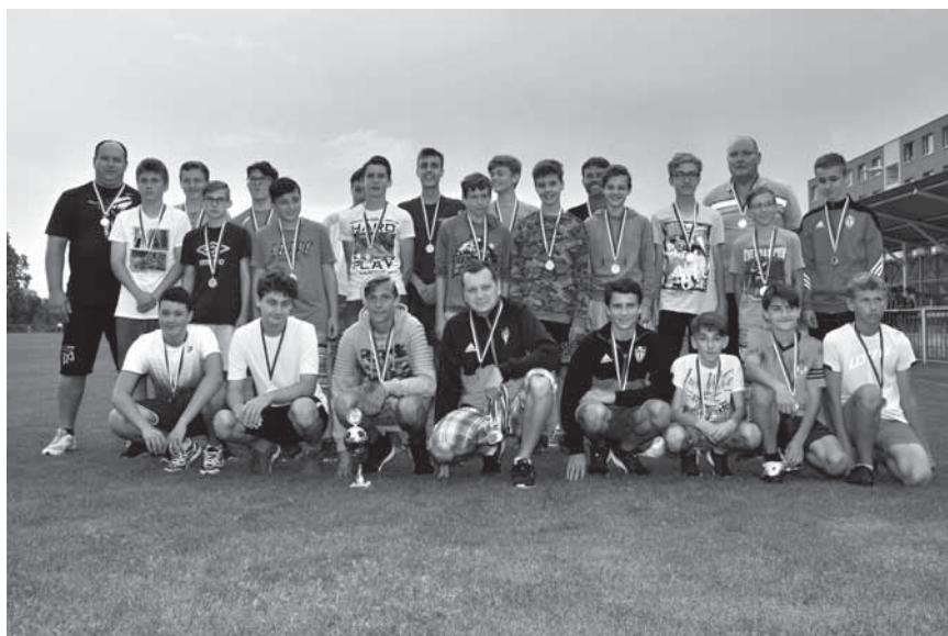
Fotky z předávání medailí starším žákům