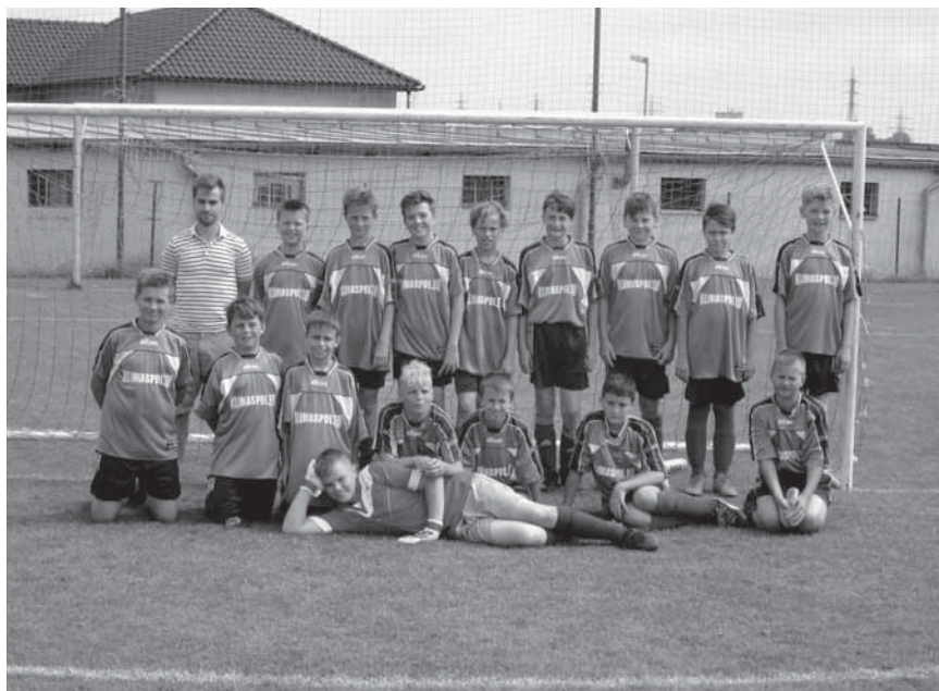
Mladší žáci „B“