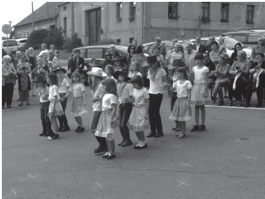
Vystoupení tanečního kroužku

Vícedenní ozdravné pobyty, filmová, divadelní představení, návštěva ovčí a farmy, dopravní hřiště, exkurze Brno, VIDA, adventní Brno, Planetárium Brno, zábavní park Bongo, výchovně vzdělávací program SLEPÍŠI – život handicapovaných, kreslení na silnici, Drakiáda, družinové sportování, kulička, Čertovský den, výtvarné tvoření pro děti a rodiče, Miniškolička – příprava na školu, cyklovýlety – Sádek, Březová, Steklý rybník, výlety do okolí Starče – Pekelnák, návštěvy knihovny Třebíč – Borovina, pasování na čtenáře 1. Třída, Můj domácí mazlíček – výstava, Den Země – sběr odpadků v okolí Starče, třídní projekty zaměřené na finanční, mediální gramotnost (3x ročně)